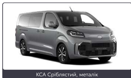
KCA Сріблястий, металік