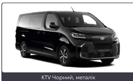
KTV Чорний, металік