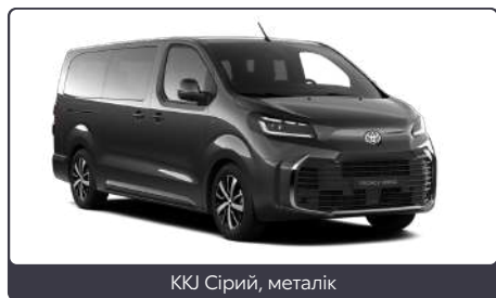
KKJ Сірий, металік